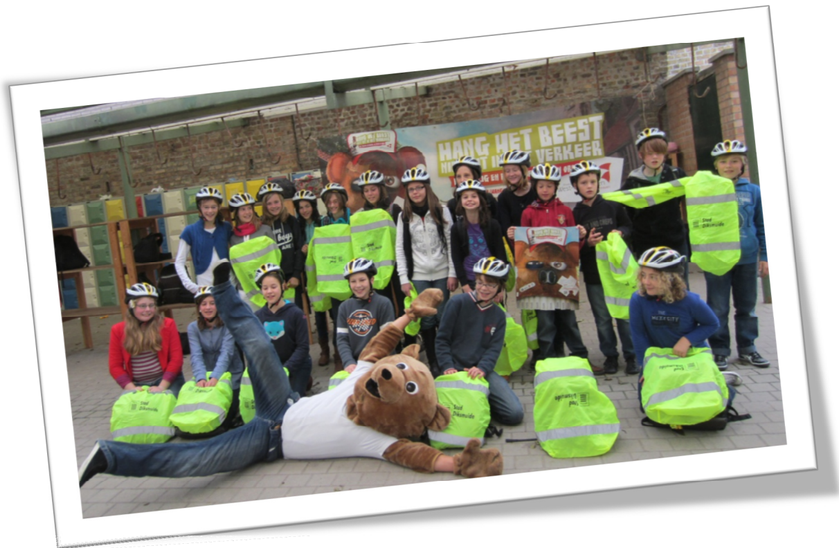
De fietscontrole met stuntbeer in het Sint-Aloysiuscollege van Diksmuide, 7/11/2011.

Tijdens de sensibiliseringsfase controleerden politie en preventiewerkers in de scholen iets meer dan 19.000 fietsen. Daarvan was een kleine 38% niet in orde waarvan bijna in de helft van de gevallen de fietsverlichting ontbrak of slecht functioneerde. Het percentage onreglementaire fietsen scoorde 4% beter dan het jaar voordien maar het aandeel defecte verlichting blijft hangen rond de 18%. Tijdens de handhavingfase werden ruimschoots 25.000 fietsen aan een controle onderworpen, een dikke 5.000 meer dan tijdens de vorige campagne. Opnieuw werd bij iets meer dan 8,5% van de controles een defect aan de fietsverlichting vastgesteld (in tegenstelling tot de 18% tijdens de preventieve controles).