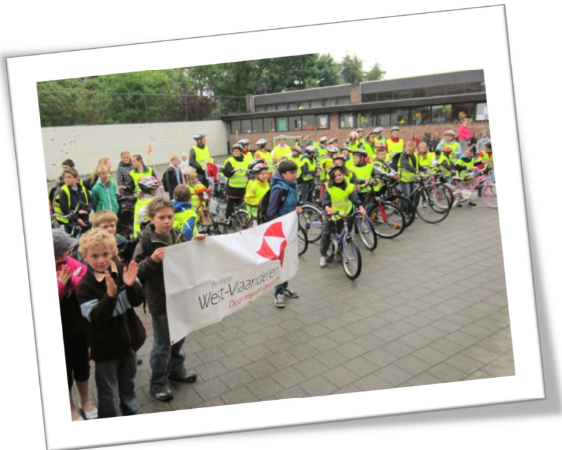
De start van de fietspool op 6 juni 2012 in de Gemeenteschool van Oedelem.

Meer informatie: www.west-vlaanderen.be/mobiliteit (> sensibilisatie, > fietspool).