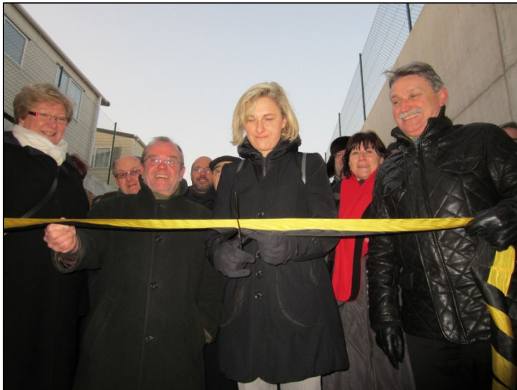
De vertegenwoordigers van de stad, provincie en de Vlaamse overheid trotseren de vrieskou voor het inhuldigen van de fietstunnel in Izegem.

De tunnel zorgt voor een veilige overstek van de N36, ter hoogte van de rotonde aan de Burgemeester Vandenbogaerdelaan en de Meensesteenweg in Izegem. De fietstunnel is erg interessant voor de vele fietsende scholieren die dagelijks dit drukke punt moeten passeren.