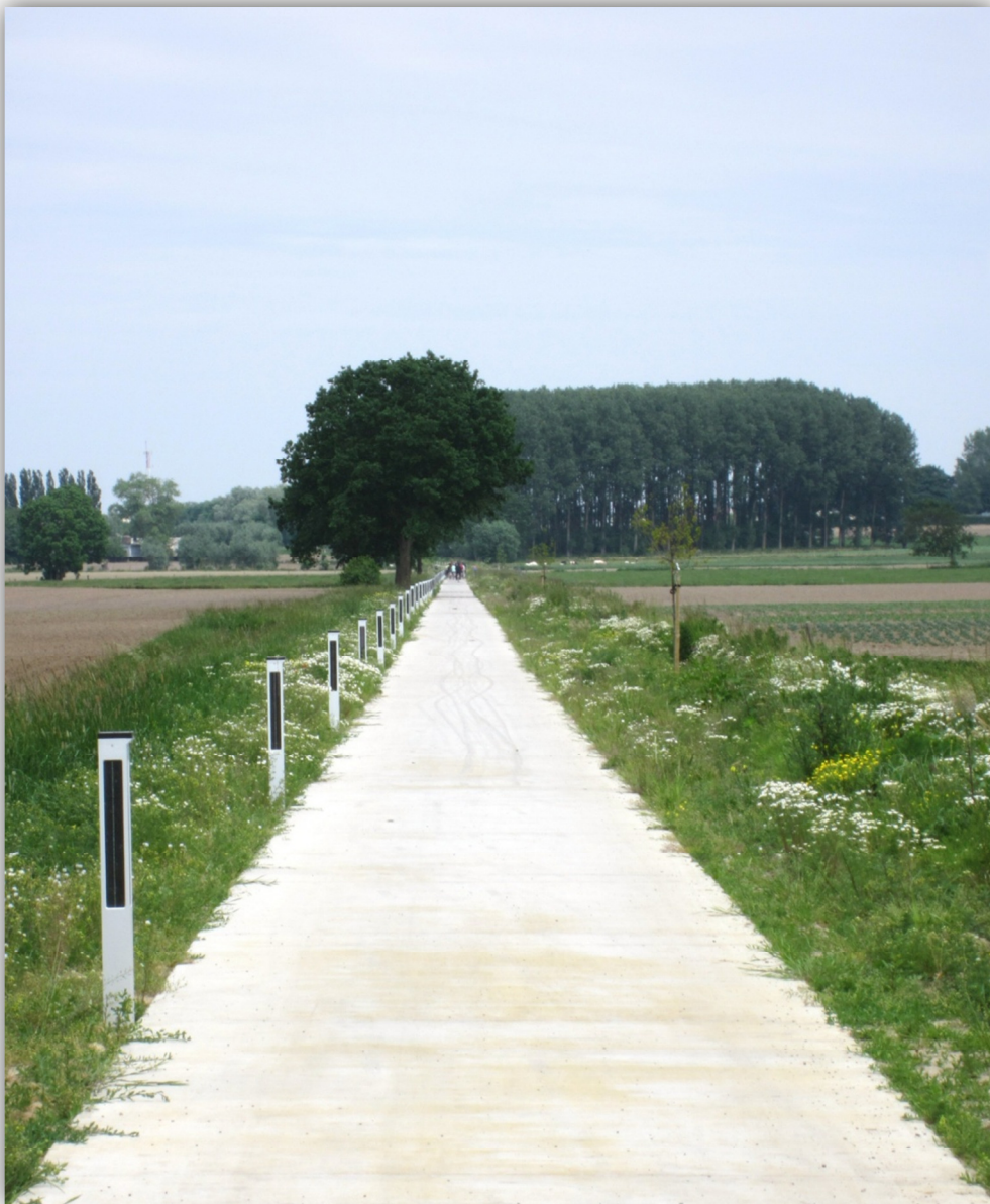
Een deel van het traject van de Stroroute met de innovatieve verlichting op zonne-energie.